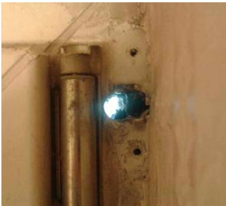
2. kép Furat

Közismert, hogy a tisztességes vállalkozások számára milyen nehéz körülményeket teremtenek az engedély nélkül tevékenykedő, felelősséget nem vállaló, csak az árletöréssel operáló, agresszív piaci magatartást folytatók, akik kihasználják, pontosabban visszaélnék a fogyasztók szűkös fizetőképességével. Szerencsére ma már egyre több pórul járt végfelhasználó megtanulta a saját kárán, hogy a látszólag olcsó, ám silány minőségű termék válik később igazán drágává a számukra.