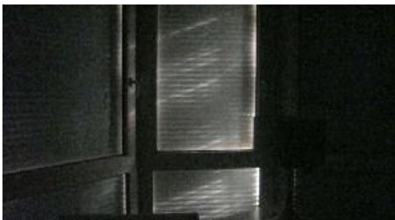
1. kép A leeresztett redőny beszűrődő fénnel

Az újjáalakult és kibővült szakmai szervezetünk tagjai az elmúlt hetekben elhatározták, hogy megkísérlik a szakmában uralkodó káosz néhány elemének a rendezését. Elképzelésünk szerint ez az alapfeltétele annak, hogy elinduljunk a mindenki számára előnyös állapotok megteremtéséhez. (Természetesen ezt nem fogadják majd jól a zavarosban halászók, a nem hosszabb távon gondolkodók, és mindazok, akik számára a mai helyzet éppen megfelelő.)